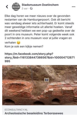
Facebook pagina museum

Naast bovenstaande PR-activiteiten zijn de social media kanalen als insta, FaceBook en twitter structureel gebruikt en bijgehouden. Ook steeds meer bezoekers delen op eigen social media kanalen berichten bij een bezoek aan museum/ VVV/ tentoonstelling. Ook vaker worden reviews achtergelaten op google. Vooral de tentoonstelling van De Graafschap trok vele bezoekers die na een bezoek foto's deelden, veel positieve reacties achter lieten en dit zorgde weer voor goede pr.