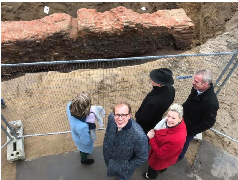
bezoek van college aan de kazemat

Tijdens de (toevallige) opgraving van de Kazemat heeft het museum in samenwerking met de gemeente Doetinchem een drietal open avonden met rondleidingen georganiseerd. Dit was een groot succes met meer dan 400 mensen die deel hebben genomen. Overdag kon deze plek bezichtigd worden. Ook daar is volop gebruik van gemaakt.