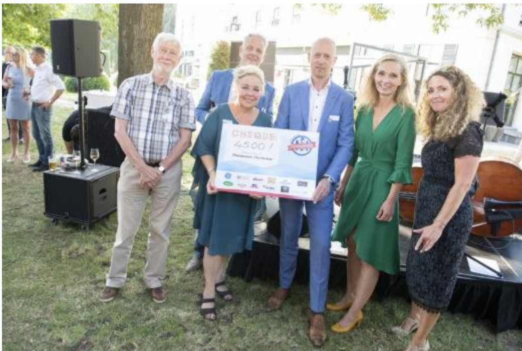
Stadsmuseum Doetinchem wint de Cor Huntelaar Ring 2019

Stadsmuseum Doetinchem is onderscheiden met de Cor Huntelaar Ring 2019 van Betaald Voetbal De Graafschap. Het Stadsmuseum wil het inspirerende cultuurhistorische centrum van Doetinchem en omgeving zijn en in die hoedanigheid als het belangrijkste bezoekerscentrum voor de stad en omgeving fungeren.